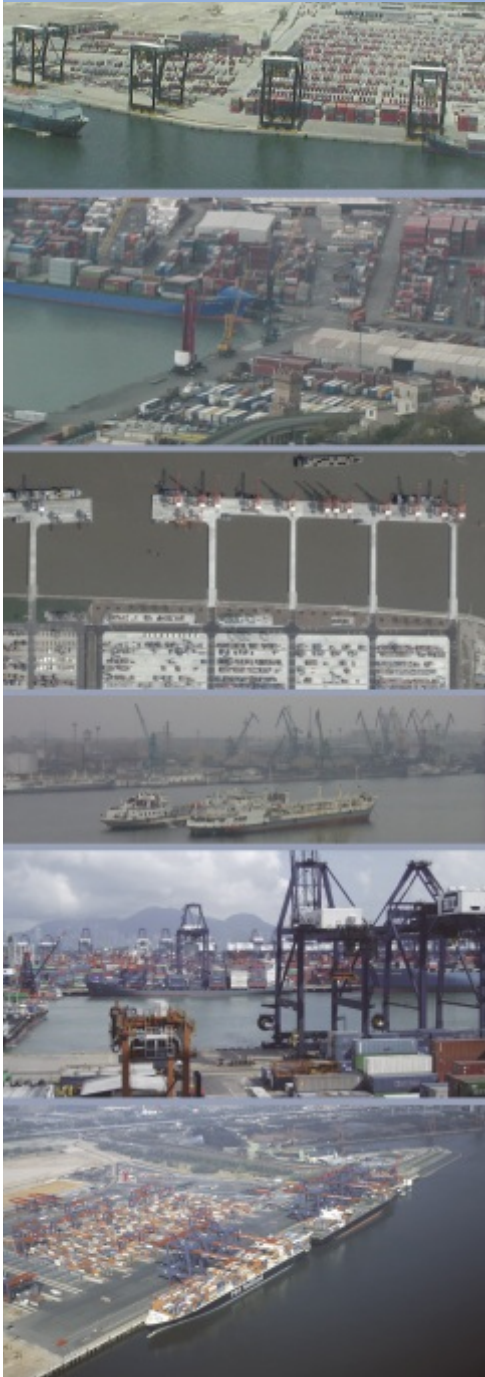
Φωτογραφίες από διαμετακομιστικούς σταθμούς απ' όλο τον κόσμο.